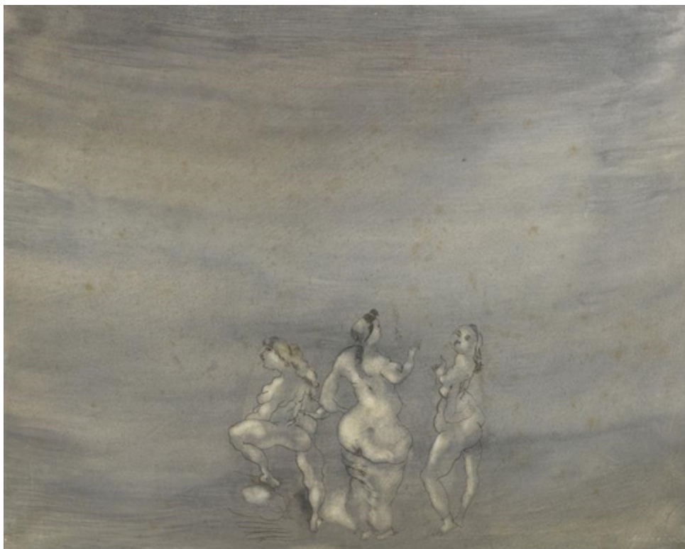
Фигура 2: Картината „Лунна светлина“ на Жюл Паскин.